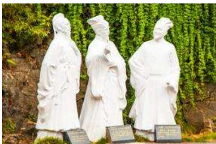
อุทยานถ้ำสามสหาย