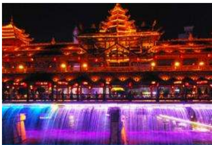
เมืองเซียงเวิน

นำท่านเดินทางสู่อุทยาน เหยี่ยวซานเสี 恩施野三峡 นำท่านล่องเรือเที่ยวชมทัศนียภาพและความสวยงามของ อุทยานแกรนด์แคนยอนชิงเจียง 清江大峡谷 ที่ได้รับการขนานนามว่าเป็นเมืองน้ำเอ็นซือ และทะเลสาบซีหู แห่งมณฑลหูเป่ย์ สายน้ำสีมรกตที่ไหลลดเคี้ยวไปตามช่องแคบระหว่างหน้าผาสูงชันและภูเขา ท่ามกลาง ทัศนียภาพของขุนเขาที่ลอยเหนือน้ำ สายธารล้อมรอบขุนเขา (ใช้เวลาล่องเรือประมาณ 40 นาที)