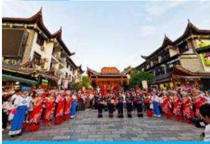
เมืองเทพริดา