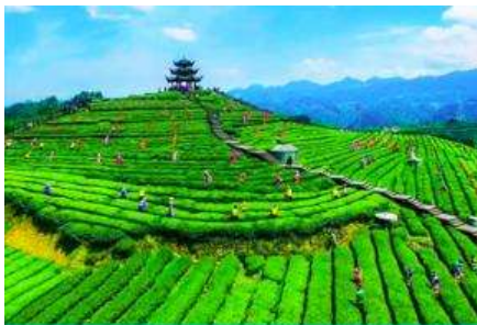
ภูเขาไร่ชาอู่เจียไถ

พักที่ โรงแรม ENSHI XIPU HOTEL ระดับ 4 ดาวท้องถิ่นหรือเทียบเท่าในเมืองเินซือ