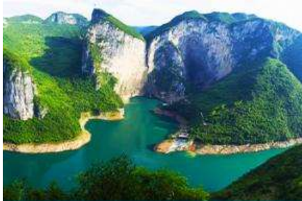
ล่องเรือชมอุทยานเหยี่ยวซานเสี