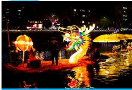
นั่งเรือมังกรเที่ยวชมความงาม