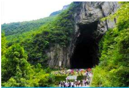
ถ้ำผญามังกร

พักที่ YICHANG HUIHAO HOTEL โรงแรมระดับ 4 ดาวหรือเทียบเท่าในเมืองหยีซัง