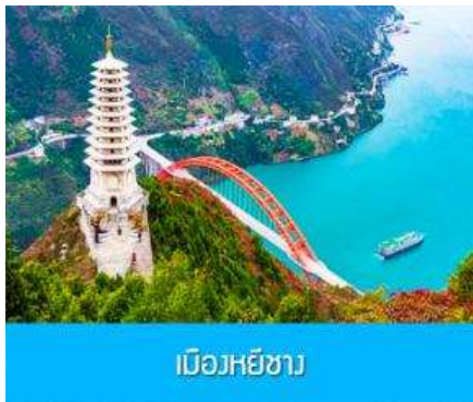
เมืองหยีซัง