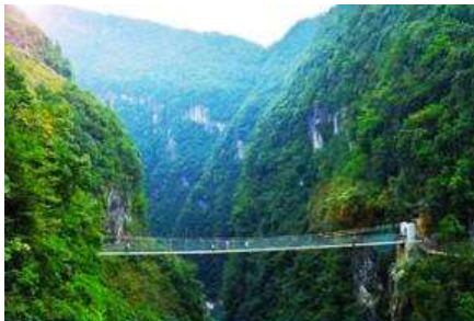
อุทยานตี้ซินกู่ (โกรกหัวใจ)

พักที่ โรงแรม ENSHI XIPU HOTEL ระดับ 4 ดาวท้องถิ่นหรือเทียบเท่าในเมืองเินซือ