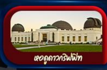
หอดูดาวหริฟฟิท

กาสิโน 10 ท่านออกเดินทาง พร้อมหัวหน้าทัวร์คนไทย