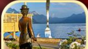
ชาลี แฮปป์ลิน THE FORK