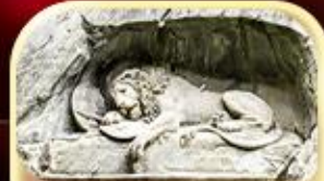
สิงโตหินแกะสลัก