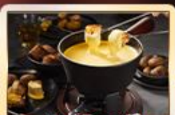
เมนูพิเศษ!! สวิสฟองดู

เบิร์น เวอว์ย เซอร์แมท อินเทอร์ลาเกน ทิตลิส ลูเซิร์น ซูริก