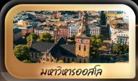
มหาวิหารออสโล