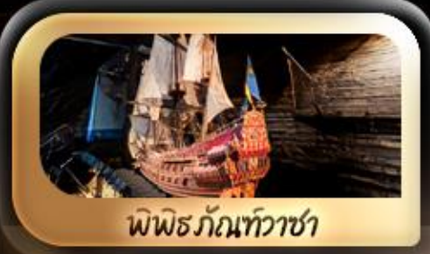
พิพิธภัณฑ์ท้าวชา