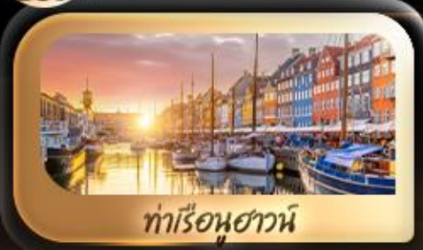
ท่าเรือฮูสวานน์