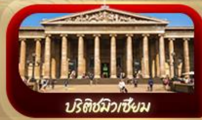
บริติชมิวเซียม