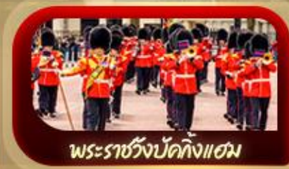
พระราชวังบักกิงแฮม

9-15 พ.ค. 68 / 29 พ.ค. - 4 มิ.ย. 68 เดินทาง