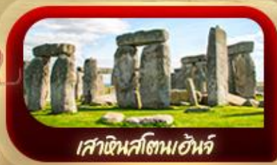
เสาหินสโตนเฮนจ์