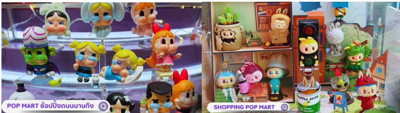
POP MART ช้อปปังถนนนานกิง

มาก พื้นที่สีเขียวริมแม่น้ำฝั่งเหนือของ The Bundท่านจะได้เห็นวิวของหอไข่มุกที่ศตวรรษออก เป็นแนวคิดที่ทำให้เมืองมหานครที่ทันสมัย และยิ่งใหญ่อย่างเซี่ยงไฮ้ให้ดูมีสีสันสบายตาตัดผสมผสานกับธรรมชาติได้อย่างลงตัว ทำให้แลนด์มาร์คแห่งนี้กลายเป็นจุดเช็คอินที่ทั้งคนพื้นที่ และนักท่องเที่ยวต่างพากันมาถ่ายรูปอย่างไม่ขาดสาย นำท่านสู่บริเวณ หาดไว่ทาน (WAITAN) ซึ่งไม่ได้เป็นหาดทรายชายทะเลแต่อย่างใด แต่เป็นย่านถนนริมแม่น้ำที่มีความยาว 1.5 กิโลเมตร ไปตามริมแม่น้ำหวงผู่ฝั่งตะวันตกซึ่งอยู่ในย่านเมืองเก่า หาดไว่ทานยังเคยเป็นสถานที่ถ่ายทำภาพยนตร์ที่โด่งดังเรื่อง “เจ้าพ่อเซี่ยงไฮ้”