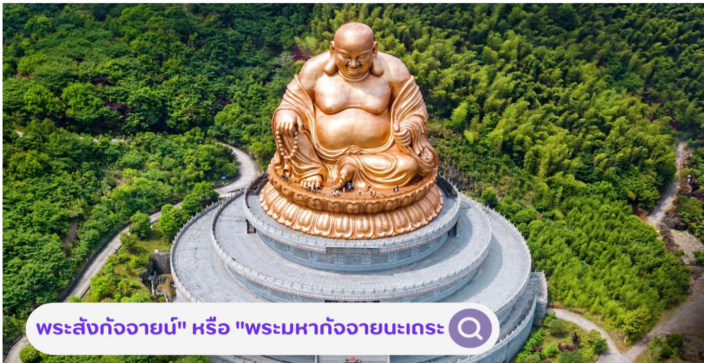
พระสังกัจจายน์" หรือ "พระมหากัจจายนะเถระ

ของพระศรีอาริย์เมตไตรย ซึ่งเป็นพระโพธิสัตว์ที่สำคัญในศาสนาพุทธ ที่วัดมีพระพุทธรูปขนาดใหญ่ที่ตั้งอยู่กลางแจ้ง พระสังกัจจายน์" หรือ "พระมหากัจจายนะเถระ" ขนาด 33 เมตร เมตร มีลักษณะที่งดงามและประณีต พระพุทธรูปนี้สร้างขึ้นด้วยวัสดุที่ทนทานและมีความสวยงามทางศิลปะ เป็นพระโพธิสัตว์ที่สำคัญในศาสนาพุทธ พระองค์เป็นสัญลักษณ์ของความเมตตาและการกรุณา และถูกเคารพสักการะว่าเป็นพระโพธิสัตว์ รอทที่จะมาตรัสรู้เป็นพระพุทธเจ้าองค์ถัดไปเมื่อสิ้นพุทธกาลของสมเด็จพระสัมมาสัมพุทธเจ้า นอกจากนี้ยังมีสถานที่อื่น ๆ ในวัดที่น่าสนใจ เช่น หอพระธรรม พิพิธภัณฑ์ และสวนและทางเดินที่สวยงาม