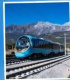
รถไฟชมวิอรอบ ภูเขาหิมะมังกรหยก