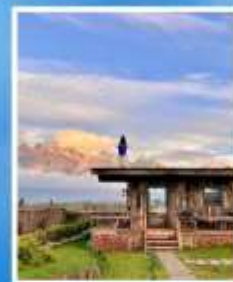
YUN DI AN CAFE