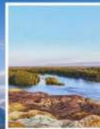
ธารน้ำ 5 สี