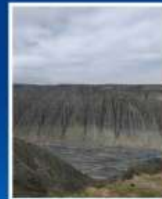
แกรนด์แคนยอน ตู้ซานจื่อ