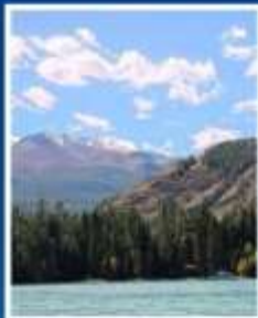
ล่องเรือ ทะเลสาบคานาสี