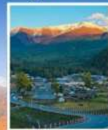
หมู่บ้านไปฮาปา