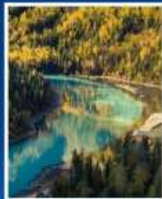
ทะเลสาบมังกรหลับ