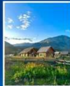
หมู่บ้านเหม่อมูซุน