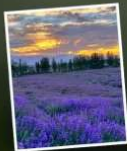
ทุ่งดอกลาเวนเดอร์