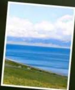
ทะเลสาบไซหลี่มู่