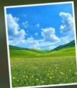
ทุ่งหญ้าแห่งท้องฟ้า