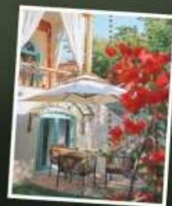
หมู่บ้านคางอันฉี