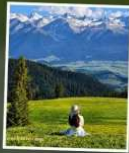
ทุ่งหญ้านาคาลาจัน