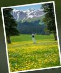
ทุ่งหญ้านาราตี