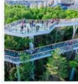
สวนต้นสน