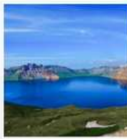
อุทยานดงไป๋ซาน