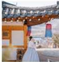
สวนวัฒนธรรม พื้นบ้านเกาหลี่