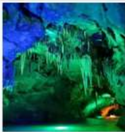
ถ้ำน้ำเป็นสี