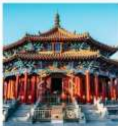
พระราชวังกุ๊กง