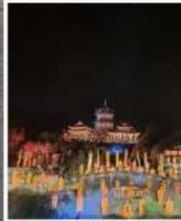
โชว์ SHAOLIN MUSIC CEREMONY