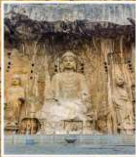
พระพุทธรูปแกะสลักหิน หลงเหมิน