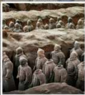
พิพิธภัณฑสถานกองทัพใต้ดิน ทหารม้าจีนซี