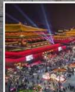
ถนนคนเดินวัฒนธรรมต้าถิง