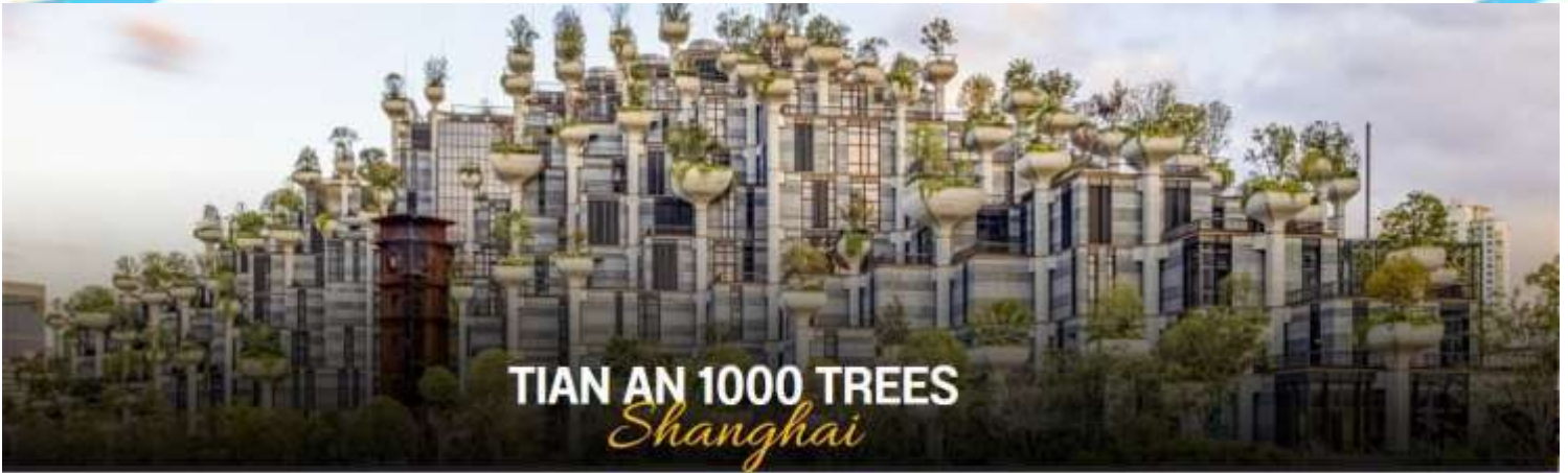
TIAN AN 1000 TREES Shanghai