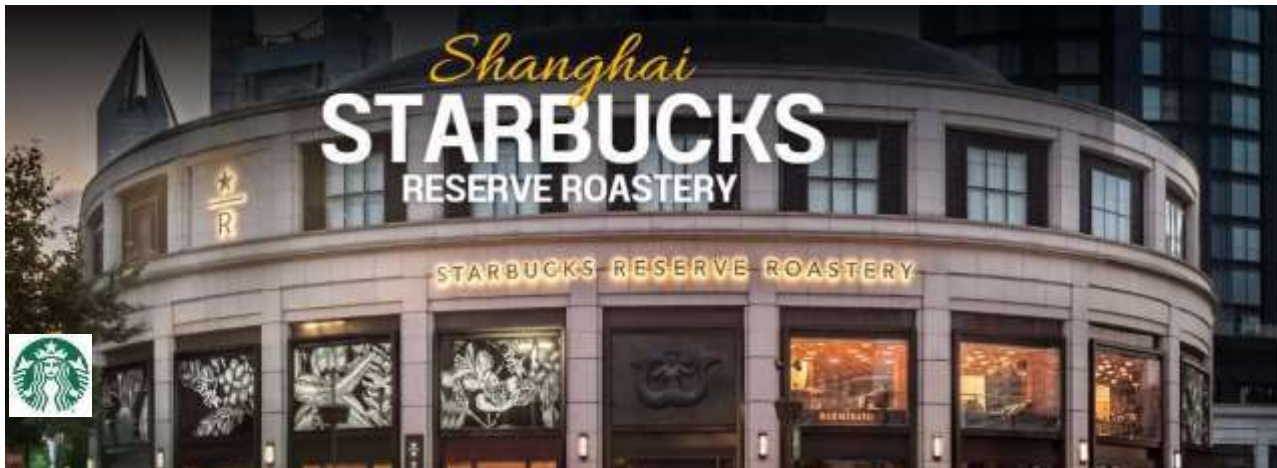
โรงคั่วกาแฟ Starbucks reserve roastery ไม่รวมค่าเครื่องดื่ม

เทียนอันเซียนซู (Tian An 1,000 Trees) ถูกออกแบบโดยโทมัส เฮเธอร์วิก สถาปนิกชาวอังกฤษโดยคาดว่าต้นไม้เหล่านี้จะสามารถดูดซับคาร์บอนไดออกไซด์ 21 ตันทุกปี กลุ่มอาคารดังกล่าวตั้งอยู่ริมฝั่งแม่น้ำซูโจวหรือแม่น้ำอู๋ซง ซึ่งครอบคลุมพื้นที่กว่า 300,000 ตารางเมตร (ราว 187 ไร่) และได้รับการขนานนามว่าเป็นสิ่งมหัศจรรย์ของโลกสมัยใหม่ที่เทียบได้กับสวนลอยบาบิโลนโบราณ ทั้งนี้ อาคารพาณิชย์ที่ตกแต่งด้วยต้นไม้นี้ ได้รับแรงบันดาลใจมาจาก 'เขาวงกต' ในมณฑลอันฮุย ซึ่งมีทิวทัศน์งดงามดุจภาพวาดและได้รับการขึ้นทะเบียนเป็นมรดกโลกโดยยูเนสโก (UNESCO) นอกจากนี้ยังหวังว่าอาคารพาณิชย์ที่ตกแต่งด้วยต้นไม้ 1,000 ต้นนี้ จะช่วยเสริมภูมิทัศน์ที่มีอยู่ของแม่น้ำอู๋ซงให้สวยงามตระการตา