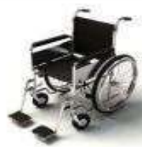
การรับการดูแลเป็นพิเศษ

กรณีผู้เดินทางต้องการความช่วยเหลือเป็นพิเศษ อาทิเช่น การใช้วีลแชร์ กรุณาแจ้งบริษัทฯ อย่างน้อย 7 วันก่อนการเดินทาง มิฉะนั้นบริษัทฯ จะไม่สามารถจัดการล่วงหน้าได้ เนื่องจากการขอใช้วีลแชร์ในสนามบินนั้น ต้องมีขั้นตอนในการขอล่วงหน้า และบางสายการบินอาจมีการเรียกเก็บค่าใช้จ่ายทั้งทางสนามบินในไทยและในต่างประเทศ ซึ่งผู้เดินทางสามารถสอบถามกับเจ้าหน้าที่ได้โดยตรงก่อนทำการจอง และหากในคณะของท่านมีผู้ต้องการดูแลพิเศษ เช่น ผู้ที่นั่งรถเข็น (Wheelchair), เด็ก, ผู้สูงอายุและผู้ที่มีโรคประจำตัวหรือไม่สะดวกในการเดินทางท่องเที่ยวในระยะเวลายาวเกินกว่า 4 - 5 ชั่วโมงติดต่อกัน ท่านและครอบครัวต้องให้การดูแลสมาชิกภายในครอบครัวของท่านเอง เนื่องจากการเดินทางเป็นหมู่คณะ หัวหน้าทัวร์มีความจำเป็นต้องดูแลคณะทัวร์ทั้งหมด