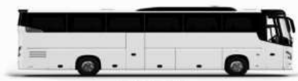
ตัวอย่างรถทัวร์ 1 คัน

ค่าที่พักตามที่ระบุในรายการหรือเทียบเท่าระดับเดียวกัน (พักห้องละ 2 ท่าน) หากประเภทห้องที่ท่านริเสกมาเต็ม อาทิ เช่น 5 วิวสองห้องพักเป็น TWIN BED หรือ DOUBLE BED ทางบริษัทขอสงวนสิทธิ์ในการปรับประเภทห้องพัก เป็นตามที่โรงแรมมีอยู่ โดยไม่ต้องแจ้งให้ทราบล่วงหน้า