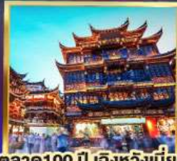
ตลาด 100 ปี เติ้งหวิงเมี่ยว