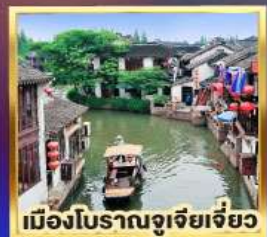
เมืองโบราณจูเจียเจียว