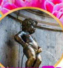
มานเคนพิส