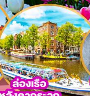
ล่องเรือ หลังคากระจก