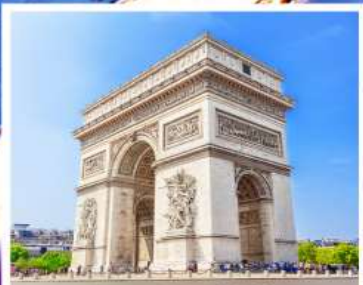
ประตูลีปารีส

เดินทาง 31 พ.ค. - 07 มิ.ย. 68 08-15 ส.ค. 68