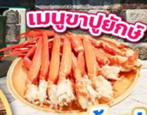
เมนูซาซิมิ