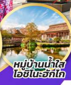
หมู่บ้านน้ำใส โอชิโนะอ๊กไก