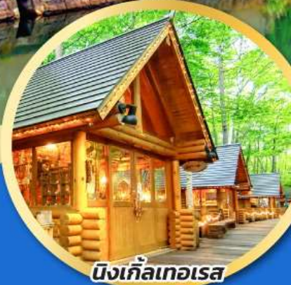
นิงเกิ้ลเทอเรส