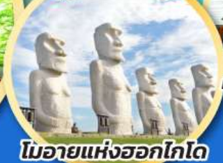
โมอายแห่งฮอกไกโด