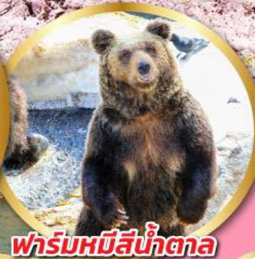
ฟาร์มหมีสีน้ำตาล