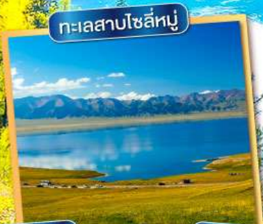
ทะเลสาบไซลีทู่