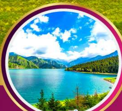
ทะเลสาบเทียนชาน