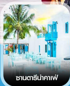
ซานตารีน่าคาพี