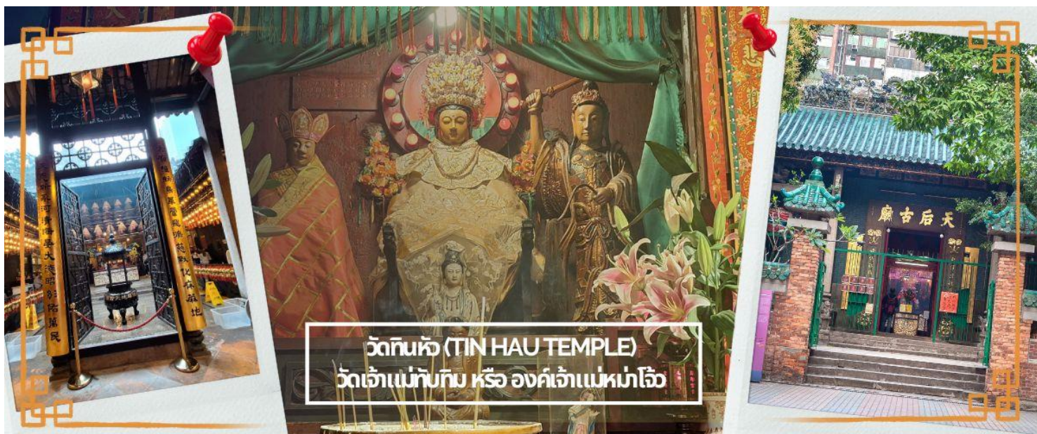
วัดทินหัว (TIN HAU TEMPLE) วัดเจ้าแม่ทับทิม หรือ องค์เจ้าแม่หม่าโจ้ว

การเงิน และความสำเร็จในชีวิตได้ตามที่ต้องการ และที่ไม่ควรพลาดกับการปิดทองที่เรือมังกร โดยมีความเชื่อว่าจะทำให้