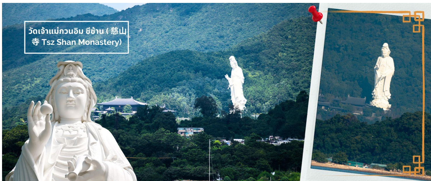
วัดเจ้าแม่กวนอิม ซีซัน (慈山寺 Tsz Shan Monastery)

จากนั้นนำท่านไหว้พระขอพร วัดเจ้าแม่กวนอิม ซีซัน (慈山寺 Tsz Shan Monastery) เจ้าแม่กวนอิมที่ใหญ่ที่สุดเป็นอันดับที่ 2 ของโลก วัดที่เปรียบเสมือนดินแดนสวรรค์บนเกาะฮ่องกง วัดพุทธขนาดใหญ่ที่มีชื่อเสียงมากแห่งหนึ่งของฮ่องกง เป็นที่ประดิษฐานรูปปั้นเจ้าแม่กวนอิมองค์ใหญ่เป็นอันดับสองของโลก เป็นสถานที่ที่มีความศักดิ์สิทธิ์ มีมนต์ขลัง ที่นี้ยังเต็มไปด้วยเรื่องราวของธรรมะ เป็นสถานที่เผยแพร่หลักคำสอนทางพระพุทธศาสนาที่สำคัญของฮ่องกงเลยทีเดียว และเป็นอีกหนึ่งวัดที่อยากแนะนำว่าหากมีโอกาสไปเยือนฮ่องกง จะต้องไม่พลาดที่จะไปสักการะเจ้าแม่กวนอิมขอพรเพื่อความเป็นสิริมงคล ครอบคลุมพื้นที่ 46,764 ตารางเมตร และตัวอาคารต่างๆ ครอบคลุมพื้นที่ประมาณ 5,100 ตารางเมตร ตั้งอยู่บนเนินเขา วิเวกเขาที่อลังการสุดๆ แวดล้อมด้วยวิวทิวทัศน์ธรรมชาติสวยงาม อากาศที่สดชื่นบริสุทธิ์ มาทีเดียวทั้งอิมบิอุและอิมใจกับความงดงามของเจ้าแม่กวนอิม