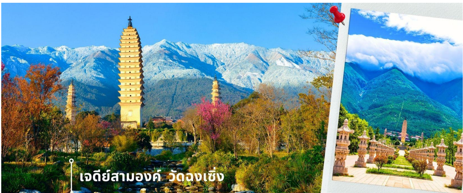
เจดีย์สามองค์ วัดจงเซิง

นำท่านชม วัดเจ้าแม่กวนอิม (ใช้เวลาเดินทาง 30 นาที) ตามตำนานเล่าว่าเจ้าแม่กวนอิมได้แปลงกายเป็นหญิงชราแบกก้อนหินใหญ่ไว้บนหลังเพื่อให้ทหารของฝ่ายตรงข้ามได้เห็นเมื่อทหารฝ่ายศัตรูได้เห็นว่ามีแม่แต่หญิงชรายังแข็งแรงถึงเพียงนี้ ถ้าเป็นคนวัยหนุ่มสาวจะต้องมีพลังกำลังมากมายยากที่จะต่อสู้ จึงทำให้ไม่ทำการเข้าโจมตีเมืองและถอยทัพกลับไป ชาวเมืองจึงสร้างวัดแห่งนี้ขึ้นในสมัยราชวงศ์ถัง ซึ่งถือว่าเป็นวัดที่มีประติมากรรมยอดเยี่ยมแห่งหนึ่งในต้าหลี่ จากนั้นผ่านชม เจดีย์สามองค์ สัญลักษณ์ของเมืองต้าหลี่ ตั้งอยู่ใน วัดจงเซิง (Chongsheng Temple) วัดเก่าแก่ที่สร้างขึ้นเมื่อศตวรรษที่ 9 นับว่าเป็นหนึ่งในเจดีย์ที่สูงที่สุดในประเทศจีน อีกทั้งยังมีความศักดิ์สิทธิ์เป็นอย่างมาก ว่ากัน