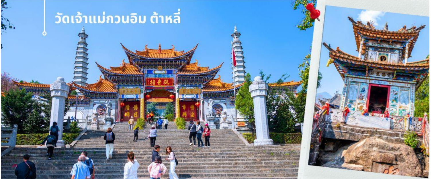
วัดเจ้าแม่กวนอิม ต้าหลี่

เช้า ๑๐ รับประทานอาหารเช้า ณ ห้องอาหารโรงแรม (4)