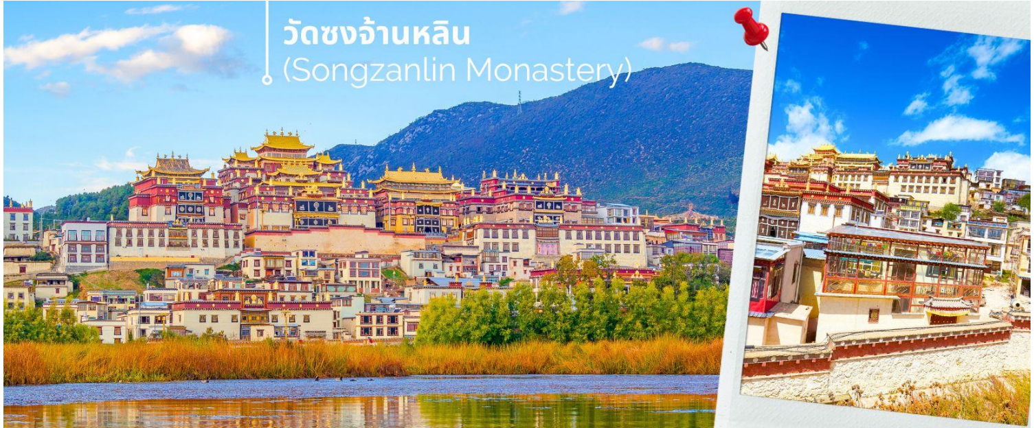
วัดชงจ้านหลิน (Songzanlin Monastery)

นำท่านชม วัดชงจ้านหลิน เป็นวัดลามะที่ใหญ่ที่สุดของมณฑล ยูนนานทางภาคตะวันตกเฉียงใต้ของจีน ถูกสร้างขึ้นในปี ค.ศ.1679 อยู่ห่างจากตัวเมืองแชงกรีล่า 5 กิโลเมตร วัดนี้เป็นอีกหนึ่งสถานที่ท่องเที่ยวสำคัญของเมืองแชงกรีล่า ประเทศจีน ถ้ามาเที่ยวแชงกรีล่าแล้วไม่ได้แวะมาวัดชงจ้านหลินก็ถือว่ายังไม่ถึงแชงกรีล่า ด้านนอกวัดสามารถถ่ายรูป