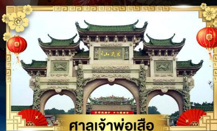
ศาลเจ้าพ่อเสือ