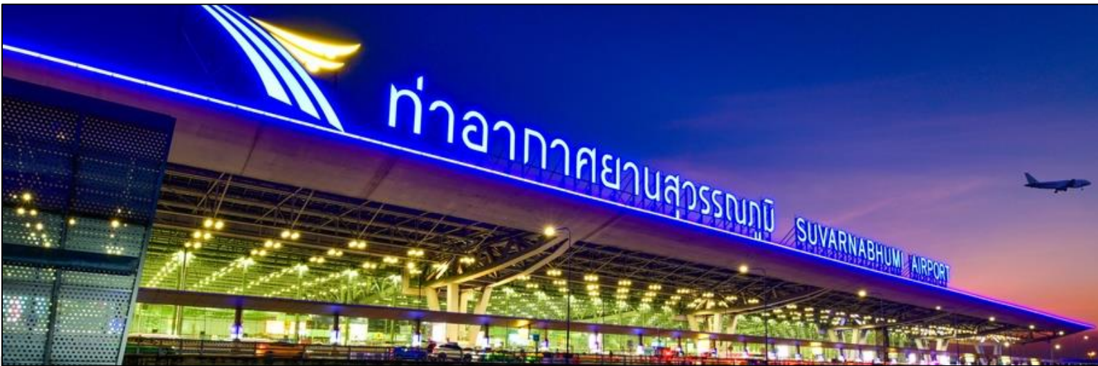
"มีใจทุกทีนง รบชมความบันเทิงไม่จุจบ"