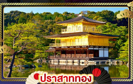
ปราสาททอง