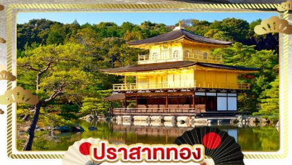
ปราสาททอง