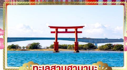
ทะเลสาบฮามานะ