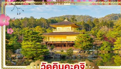
วัดคินคะคุจิ