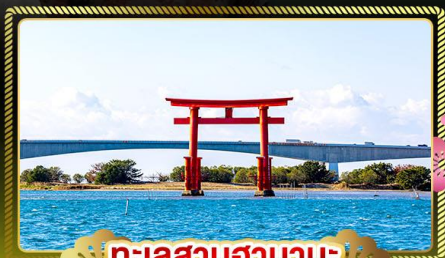
ทะเลสาบฮามานะ