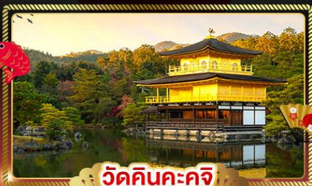
วัดคินคะคุจิ