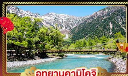
อุทยานคาบิโคจิ