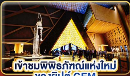
เข้าชมพิพิธภัณฑ์แห่งใหม่ ของอียิปต์ GEM