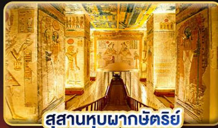
สุสานหุบผากษัตริย์