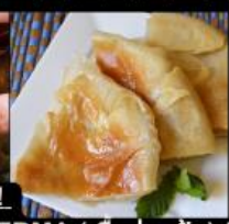
เมนูสุดพิเศษ !! KOSHARI (ข้าวคั่วกั่ว) / SHAWERMA (เนื้อห่อแป้ง) / FITEER BALADI (พิซซ่าอียิปต์)