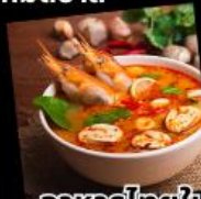
อาหารไทยในไคโร