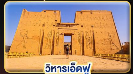
วิหารเอ็ดฟู