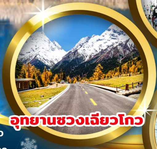
อุทยานหวงเฉียวโกว