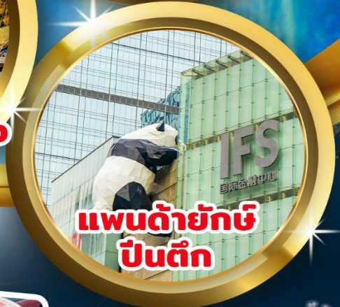
แพนด้ายักษ์ ปิ่นตึก