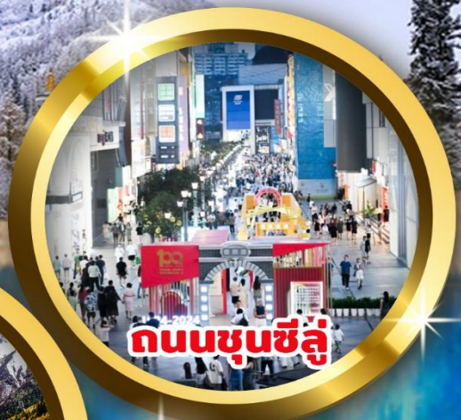
ถนนชุนชี่ลู่