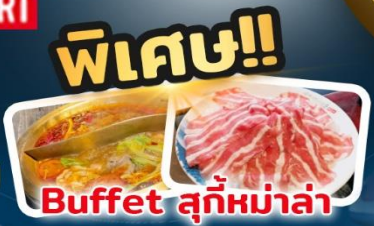
พิเศษ!! Buffet สุกี่หม่าล่า