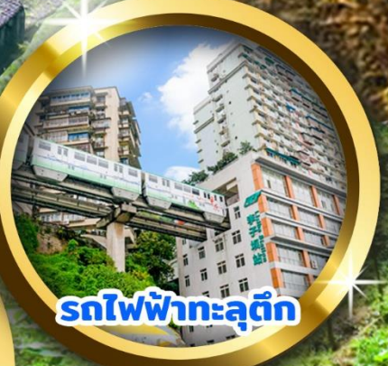
รถไฟฟ้าทะลุคิต