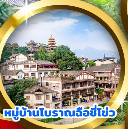
หมู่บ้านโบราณฉือชี่โข่ว