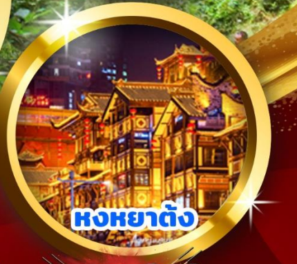
หงหยาดั่ง