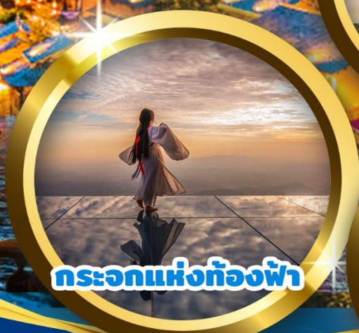
กระบอกแห่งท้องฟ้า