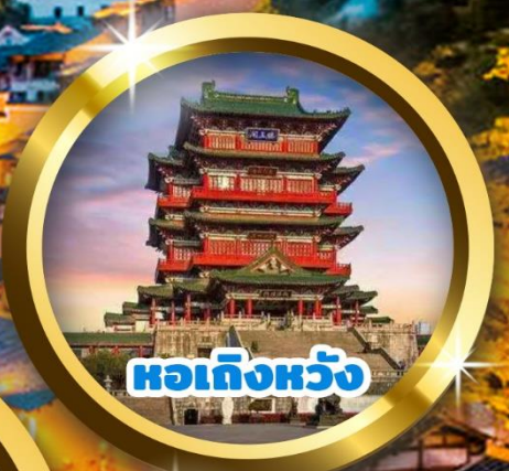
หอเถิงหวัง