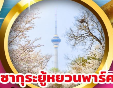
ชาคุระอยู่หยวนพาร์ค