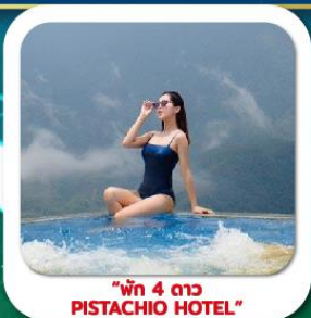
"พัก 4 ดาว PISTACHIO HOTEL"