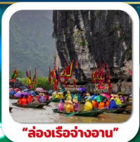
"ล่องเรืออ่างฮาน"

ท่องเที่ยวแดนแห่งสายหมอก "พัก PISTACHIO ซาปา 2 คืน" • MOANA CAFE นั่งกระเช้า + โยนเรือขึ้นยอดฟานสิปัน • หมู่บ้านกึ่งถ้ำ • ล่องเรืออ่างฮาน (ینگห์บิงห์) วัดหงอกเชิน • ทะเลสาบคินดาบ • ทางรถไฟฮานอย • ชมโซว์กระบองน้ำ