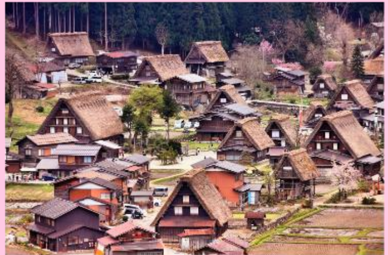
รูปใช้เพื่อประกอบการโดยภาพเท่านั้น