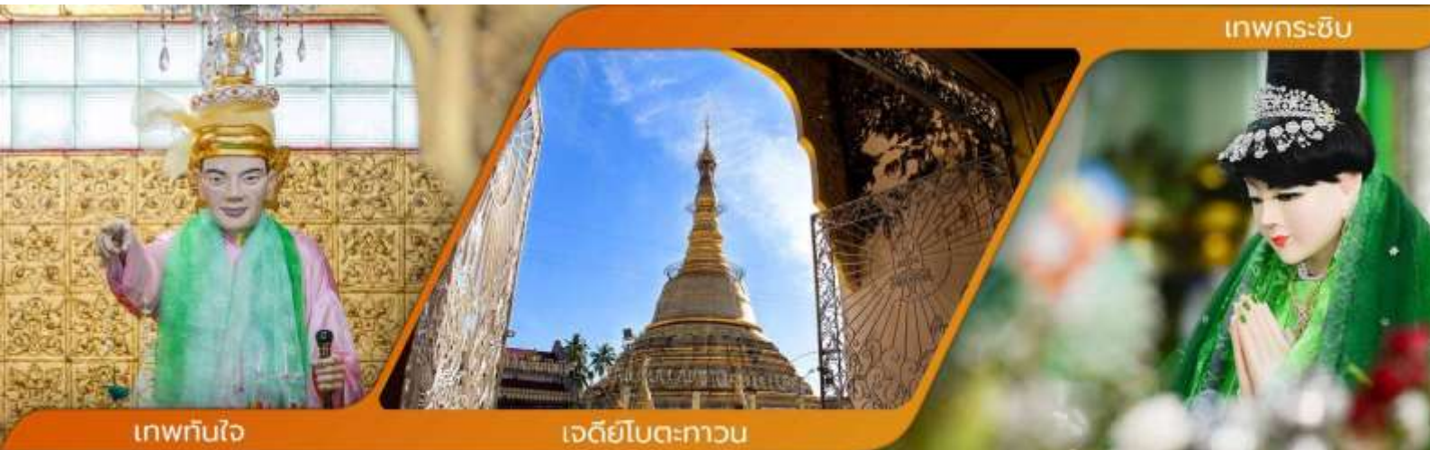
เทพกระซิบ

คำบูชาเทพทันใจ เอหิ สักกะ มหานัทโปะโปะจีโปตะถ่องสิทธิมัตถุ อิทังพะลัง เอตัสสะมิงรัตตะนัง