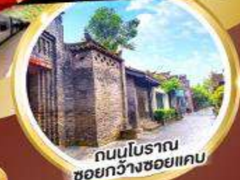
ถนนโบราณ ชอยกว้างชอยแคบ