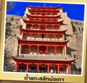
กำแพงสลักม่อเกา