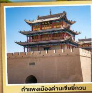
กำแพงเมืองด่านเจียหยี่กวน