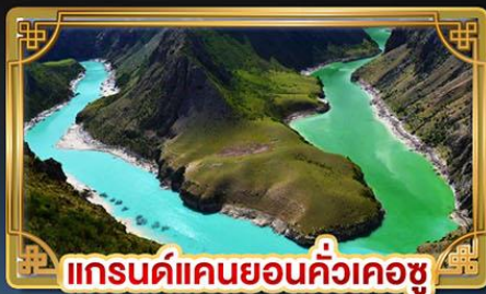
แกรนด์แคนยอนคิ้วเคอซู