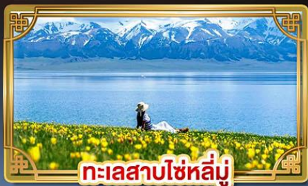
ทะเลสาบไซหลี่มู่