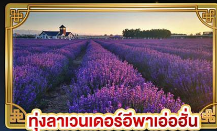
ทุ่งลาเวนเดอร์อิฟาอ้ออิ่น