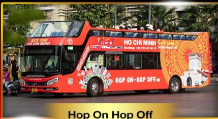
Hop On Hop Off