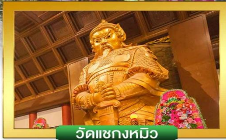
วัดเซี่ยงหมิว