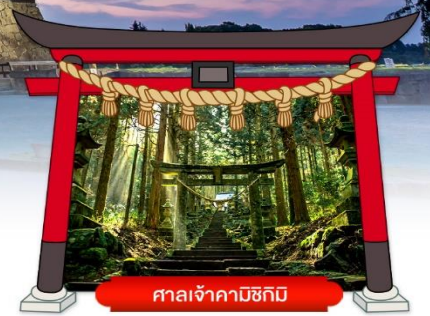
ศาลเจ้าคามิชิคิมิ