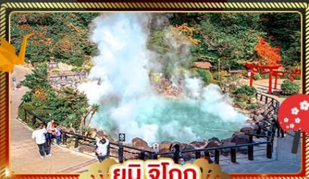
♨️ ยูมิจิโกกุ