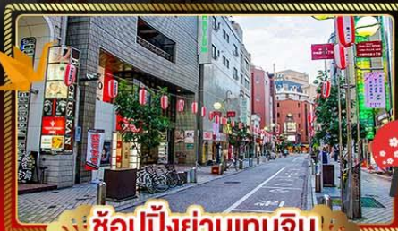
🛍️ ช้อปปิ้งย่านเทนจิน