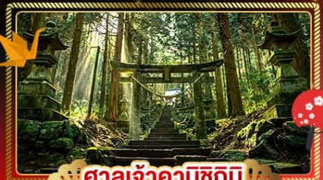
🏯 ศาลเจ้าคามิซึกิมิ