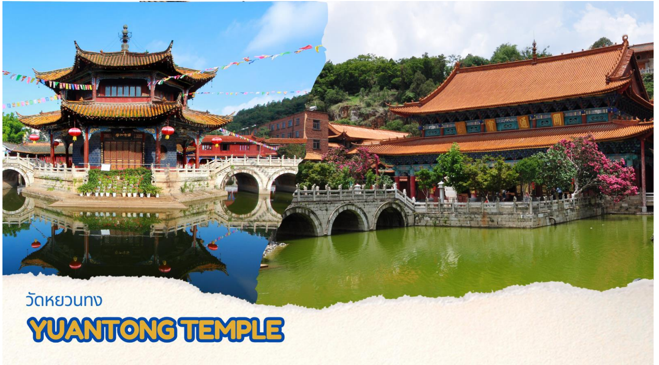
วัดหยวนทอง

กลางลานมีสระน้ำขนาดใหญ่ แต่การสร้างวัดแห่งนี้ดูแล้วจะแปลกตากว่าวัดอื่นๆในจีน เพราะปกติแล้วการสร้างวัดของจีนส่วนมากจะต้องสร้างอยู่บนภูเขา มีแต่วัดหยวนทองที่สร้างแปลกที่สุดในจีนคือสร้างวัดต่ำกว่าภูเขา โดยวิหารจะอยู่ต่ำที่สุด เนื่องจากวัดแห่งนี้ ไม่ได้สร้างขึ้นเพื่อเป็นวัดโดยตรง แต่เคยเป็นศาลเจ้าแม่กวนอิมมาก่อน ดังนั้นคำว่า “หยวนทอง” จึงเป็นชื่อที่ปรากฏในคัมภีร์ของเจ้าแม่กวนอิม มีสะพานข้ามไปสู่ศาลาแปดเหลี่ยมกลางสระน้ำมรกต มีทั้งปลา, เต่าอยู่มากมาย ศาลาหลังนี้ผู้ชนกุ้ยสร้างในสมัยราชวงศ์ชิง ในศาลาประดิษฐาน “เจ้าแม่กวนอิมพันกร” และเจ้าแม่กวนอิมพม่า หรือเรียกว่า “เจ้าแม่กวนอิมหยก”