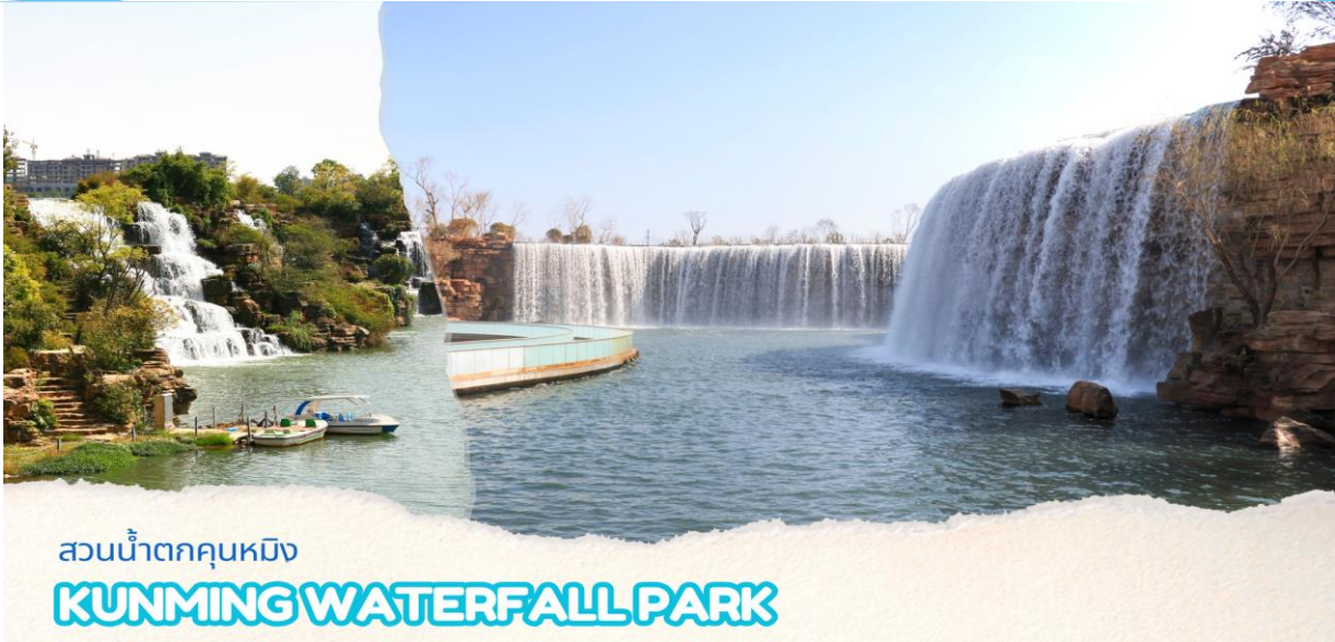
สวนน้ำตกคุนหมิง