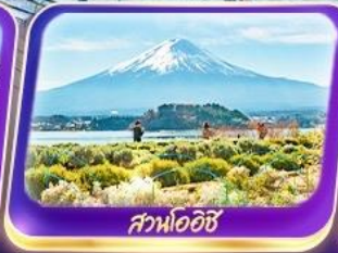
สวนโออิชิ