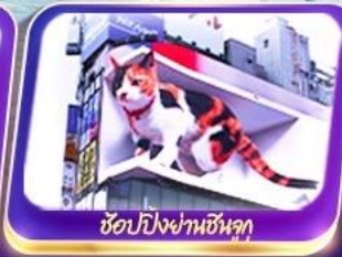
ซ้อปปิงย่านชินจูกุ