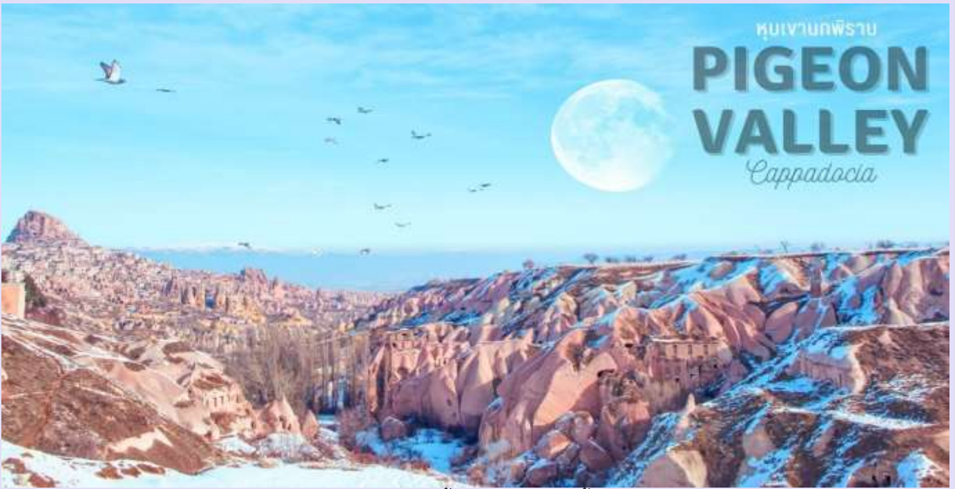
หุบเขานกพิราบ PIGEON VALLEY Cappadocia

นำท่านชม หุบเขานกพิราบ (PIGEON VALLEY) จุดชมวิวอยู่ตรงบริเวณหน้าผาที่ชาวเมืองโบราณได้ขุดเจาะเป็นรู เพื่อให้นกพิราบเข้าไปทำรังอาศัยอยู่ ชาวบ้านเลี้ยงนกพิราบไว้เพื่อนำมูลมาทำเป็นปุ๋ยบำรุงต้นไม้ จากจุดชมวิวสามารถมองเห็นปราสาทอุชิซาร์ (UCHISAR CASTLE) และยังมีต้นไม้จำลองที่เต็มไปด้วยดวงตาสีฟ้าแวววาวอยู่โดดเด่น อีสรระถ่ายภาพตามอัธยาศัย