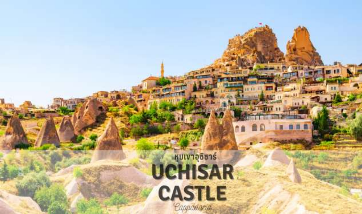
หุบเขาอุชิซาร์ UCHISAR CASTLE Cappadocia

นำท่านชม หุบเขานกพิราบ (PIGEON VALLEY) จุดชมวิวอยู่ตรงบริเวณหน้าผาที่ชาวเมืองโบราณได้ขุดเจาะเป็นรู เพื่อให้นกพิราบเข้าไปทำรังอาศัยอยู่ ชาวบ้านเลี้ยงนกพิราบไว้เพื่อนำมูลมาทำเป็นปุ๋ยบำรุงต้นไม้ จากจุดชมวิวสามารถมองเห็นปราสาทอุชิซาร์ (UCHISAR CASTLE) และยังมีต้นไม้จำลองที่เต็มไปด้วยดวงตาสีฟ้าแวววาวอยู่โดดเด่น อีสรระถ่ายภาพตามอัธยาศัย