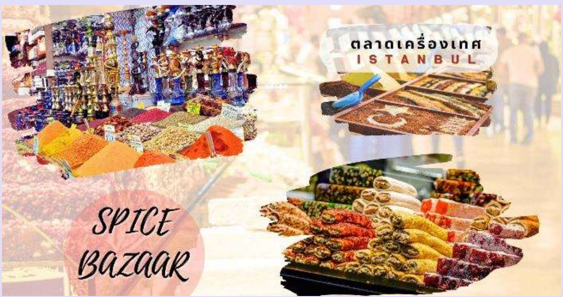
กลางวัน อิสระอาหารกลางวันตามอัธยาศัย

เดินทางสู่ ย่านการค้าชื่อดัง แกรนด์บาร์ซาร์ (Grand Bazaar) ซึ่งเป็นตลาดเก่าแก่ที่สร้างในสมัยกลาง ค.ศ. 15 เป็นตลาดค้าพรมและทองที่ใหญ่ที่สุดของตุรเคีย มีร้านค้ากว่า 4,000 ร้าน ให้ท่านได้เพลิดเพลินกับการ เลือกซื้อสินค้าที่มีชื่อเสียงของตุรเคียอย่างจุใจ เช่น โคมไฟ, ของฝาก, ผ้าพันคอ ฯลฯ