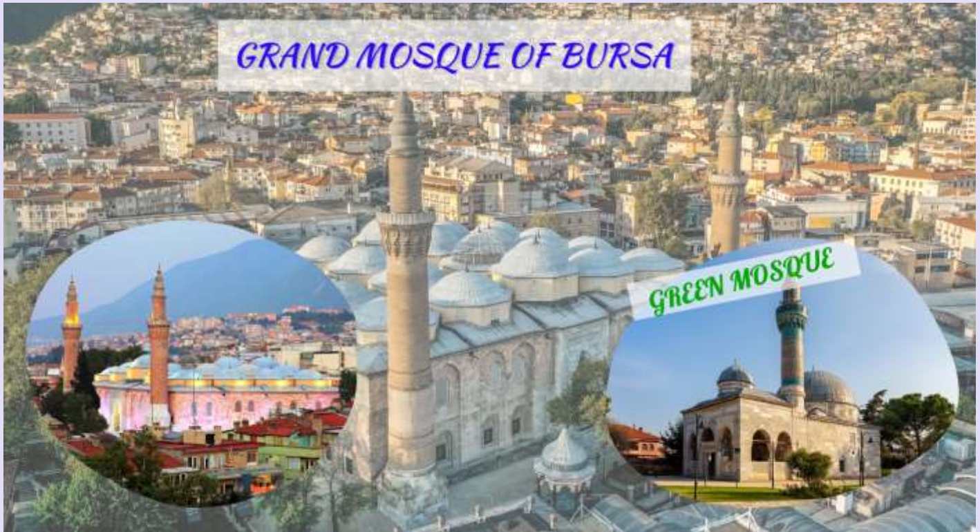
GRAND MOSQUE OF BURSA