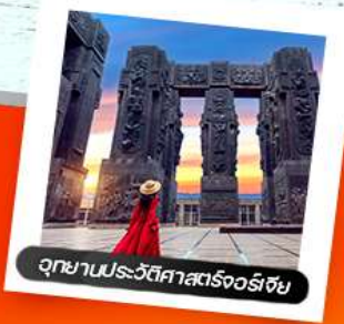
อุทยานประวัติศาสตร์จอร์เจีย