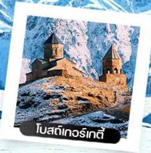
โบสถ์เกอร์เกตี้