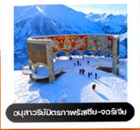
อนุสาวรีย์มิตรภาพรัสเซีย-จอร์เจีย