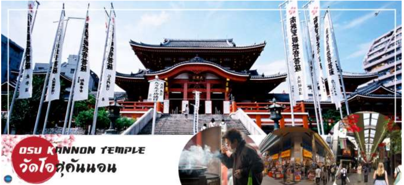
OSU KANNON TEMPLE วัดโอสถคันนอน

วันที่สี่ เมืองนาโกย่า – วัดโอสถคันนอน – ถนนช้อปปิ้งโอส – สวนดอกไม้มะนะนะ โนะ ชาโตะ – แฉะ ดริม เอ๊าท์เล็ท