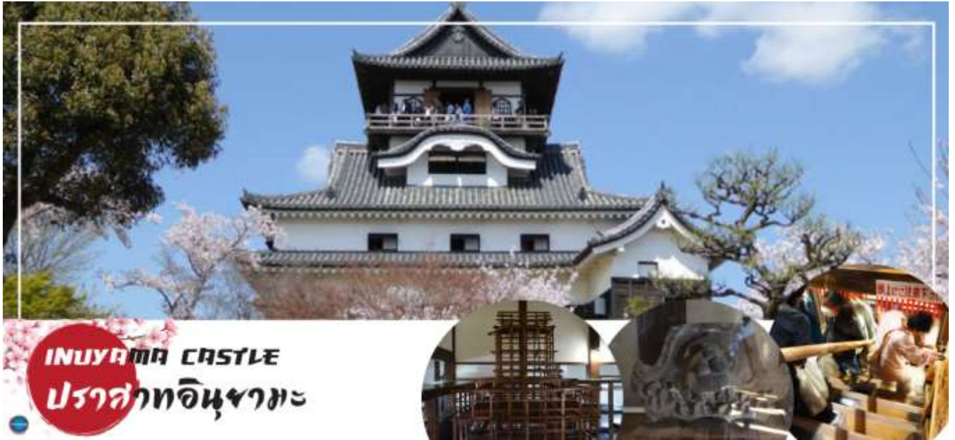
INUYAMA CASTLE ปราสาทอินยามะ

วันที่สอง ท่าอากาศยานนานาชาติซูเซ็นแทรร์ นาโกย่า – เมืองอินยามะ – ปราสาทอินยามะ(เช้าชม) – ศาลเจ้าซังโคอินาริ – ย่านเมืองเก่าอินยามะโจคามาคิ – เมืองกิฟุ – อีออน มอลล์