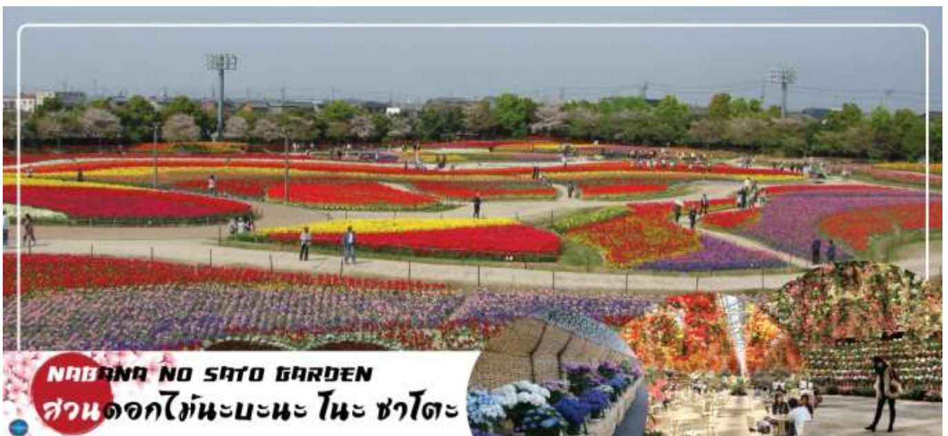
NABANA NO SATO GARDEN สวนดอกไม้มะนะนะ โนะ ชาโตะ

เที่ยง อิสระรับประทานอาหารกลางวันตามอัธยาศัย