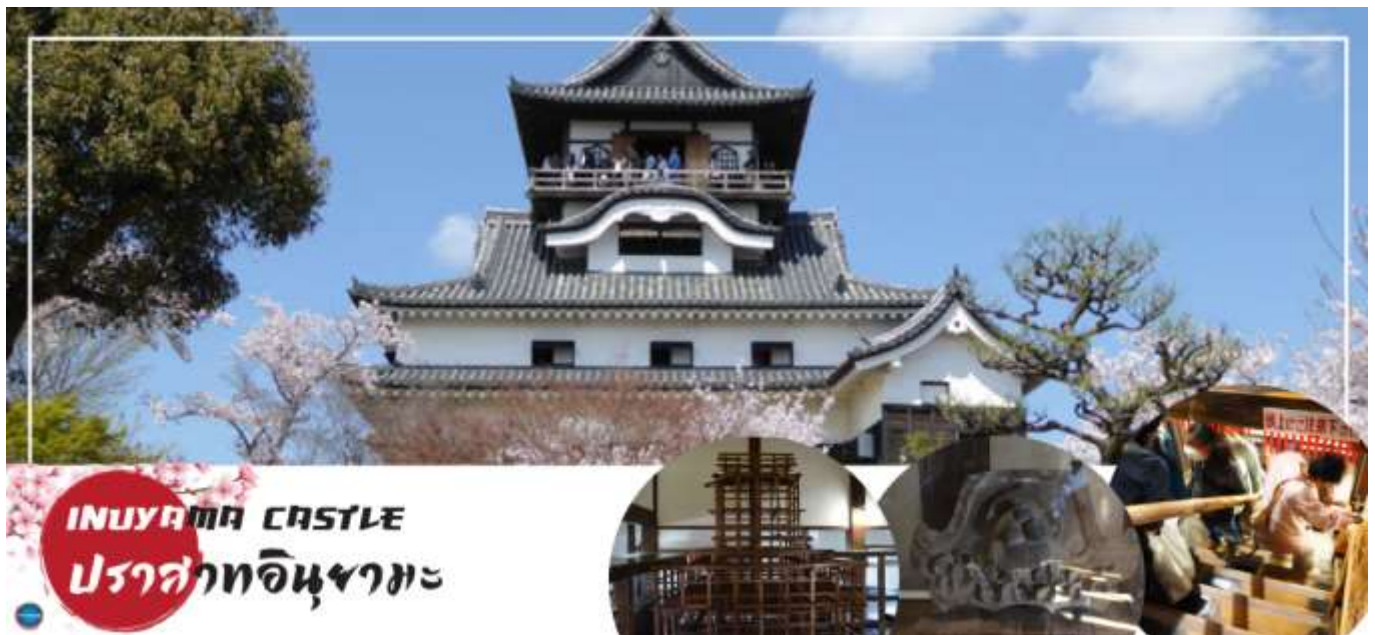
INUYAMA CASTLE ปราสาทอินยามะ

วันที่สาม เมืองนาโกย่า – เมืองอินยามะ – ปราสาทอินยามะ(เข้าชม) (จุดชมซากุระขึ้นกับภูมิอากาศ) – ศาลเจ้าซังโคอินาริ – ย่านเมืองเก่าอินยามะโจคามาจิ – เมืองกิฟู – หมู่บ้านมรดกโลกชิราคาวาโกะ – เมืองทาคายามะ – อนุเซ็น